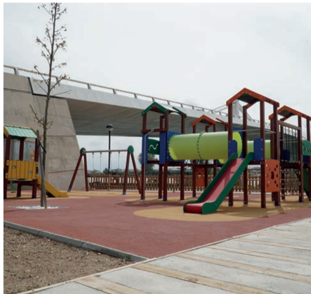
Nou parc infantil al Parc Fluvial del Delta.