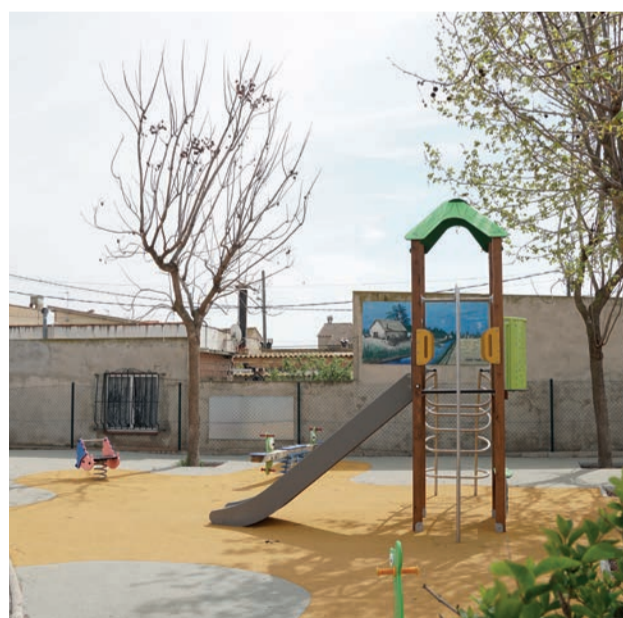
Parc infantil de la plaça del Barracot.