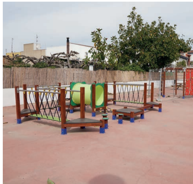
Parc infantil de la plaça Coliseum.