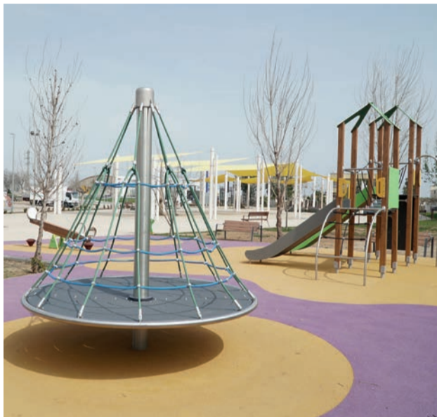
Nou parc infantil a la plaça de les Dones.