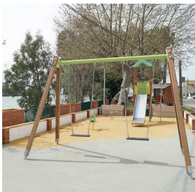
Adequació del parc de la plaça del Molí dels Mirons.