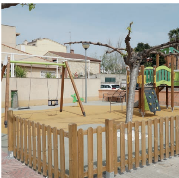
Adequació del parc de l'avinguda Esportiva.