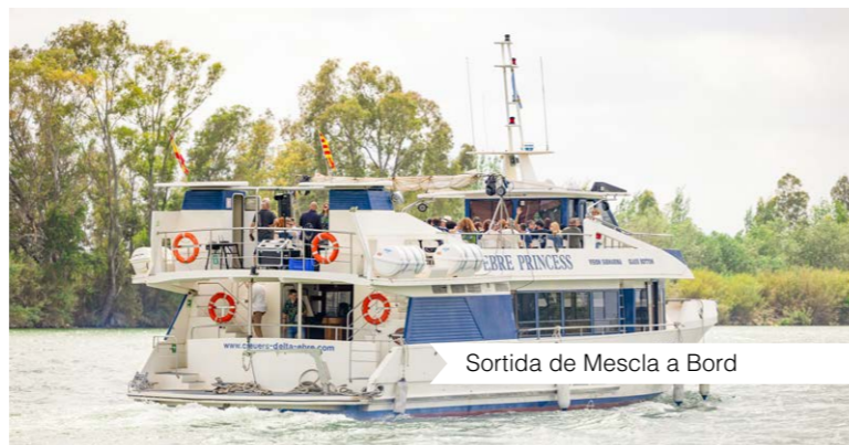
Sortida de Mescla a Bord