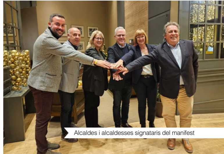
Alcaldes i alcaldesses signataris del manifest

Entre les diverses inquietuds plantejades, el manifest defensa l'autonomia local i posa en dubte la validesa del decret, raonant la falta de consideració cap a les particularitats de cada localitat. De fet, els seus signataris subratllen l'impacte econòmic negatiu que aquesta regulació podria tenir en les economies locals.