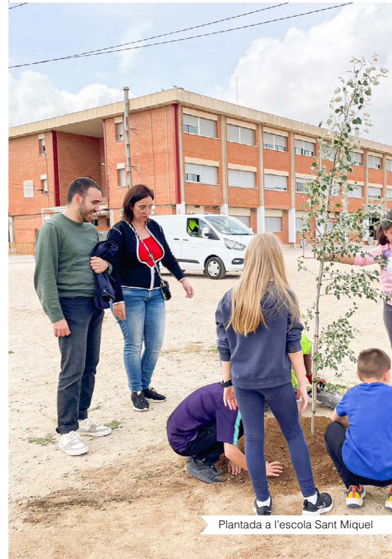
Plantada a l'escola Sant Miquel

Més enllà de les campanyes de conscienciació habituals i de la instal·lació de més de 800 plaques fotovoltaïques en equipaments municipals, durant aquests darrers cinc anys, s'han plantat al voltant de 1.000 arbres en diferents carrers, espais i equipaments municipals. Sense anar més lluny, el passat any 2023 els alumnes de les diferents escoles van plantar 250 arbres al Passeig del Riu.