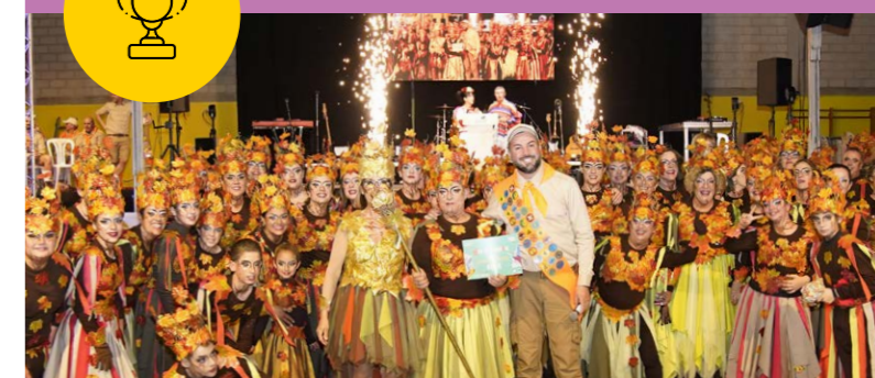
Assoc. de Veïns del Barracot, premi Millor Comparsa