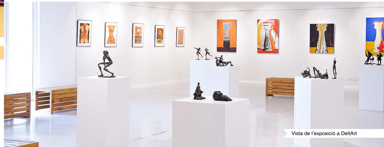
Vista de l'exposició a DeltArt