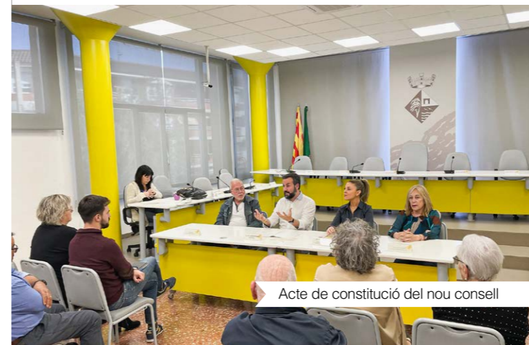
Acte de constitució del nou consell

Deltebre avança, es transforma, i ho fa també des de la mirada i aportacions de les generacions que construiran el municipi del futur. És en aquest context que neix el Consell Municipal de la Infància, òrgan que vol fomentar els valors de la participació i de la democràcia, així com crear espais de trobada, de reflexió i de diàleg per garantir que la veu dels seus representants tingui repercussió en les polítiques municipals.