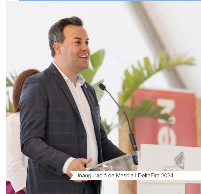
Inauguració de Mescla i DeltaFira 2024