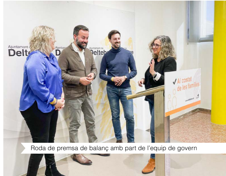
Roda de premsa de balanç amb part de l'equip de govern

I és que, amb la intenció de fomentar la igualtat d'oportunitats entre la ciutadania, s'han adjudicat fins a 2.045 ajuts des de l'arribada de l'actual govern municipal. Una intenció que es va refermant anualment i per a la qual, en aquest exercici, es destinarà una dotació econòmica d'uns 400.000 €.