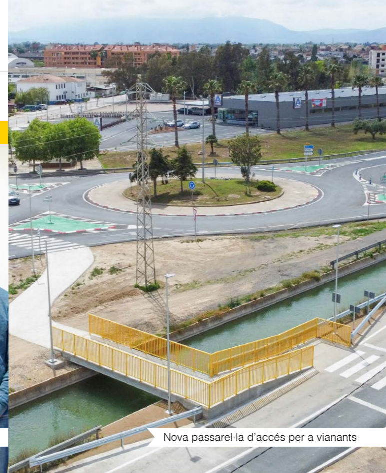
Nova passarel·la d'accés per a vianants

Aquest es manté en l'edifici annex a l'ajuntament i és: ⌚ de 9.30 a 14 h i, durant una tarda de la setmana, de 17 a 20 h.