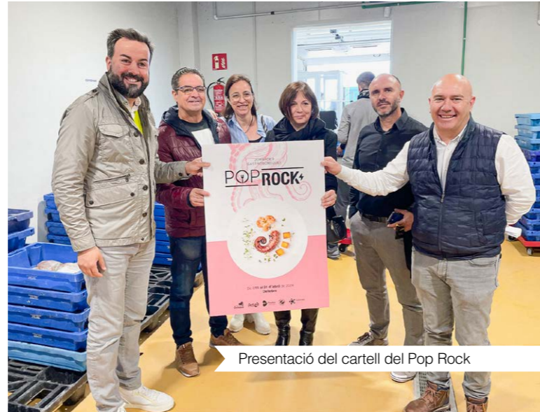
Presentació del cartell del Pop Rock

Distribuït en vuit àmbits i 32 programes, el pla compta amb un centenar d'accions integrades en quatre objectius definits: acompanyar el col·lectiu jove, fomentar la seva participació, brindar-los oferta d'oci i d'ocupació, i desplegar accions des de la perspectiva de gènere i la mirada inclusiva.