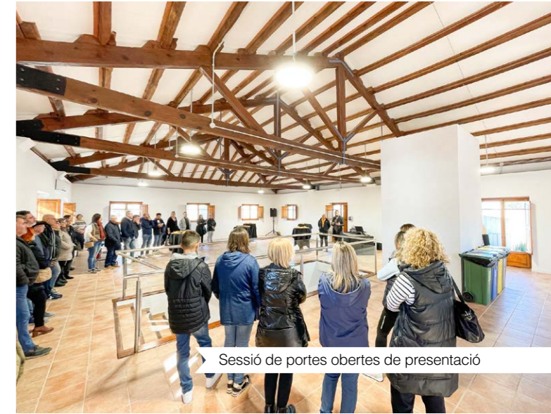
Sessió de portes obertes de presentació

Les actuacions, presentades en una sessió de portes obertes, han consistit en la rehabilitació interior, la renovació dels banys, la reparació de finestres i portes, la instal·lació d'un ascensor, la millora de la il·luminació interior i la climatització, entre d'altres. El cost ha ascendit a 170.000 €, dels quals 69.992,01 € han estat sufragats amb una subvenció LEADER.