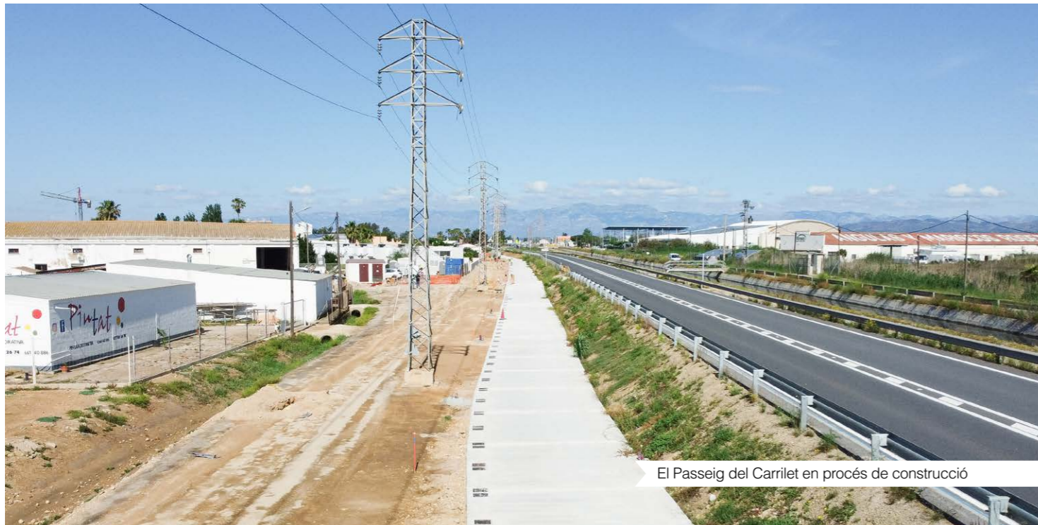
El Passeig del Carrilet en procés de construcció

Amb les obres del Passeig del Carrilet, es transformarà la façana nord per solucionar un dels problemes estructurals i recurrents del municipi, i ser, alhora, una oportunitat per impulsar i dinamitzar el turisme. Per fer-ho possible, el projecte inclou la canalització i bombeig del desaigüe del Préstamo, i la conversió d'aquest desaigüe en un passeig amb carril bici i amb la implantació de serveis turístics.