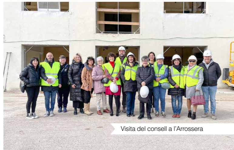
Visita del consell a l'Arrossera