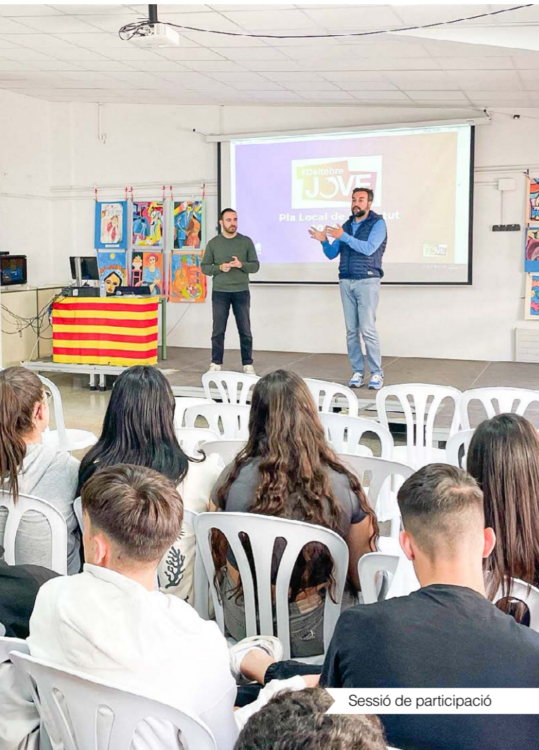
Sessió de participació