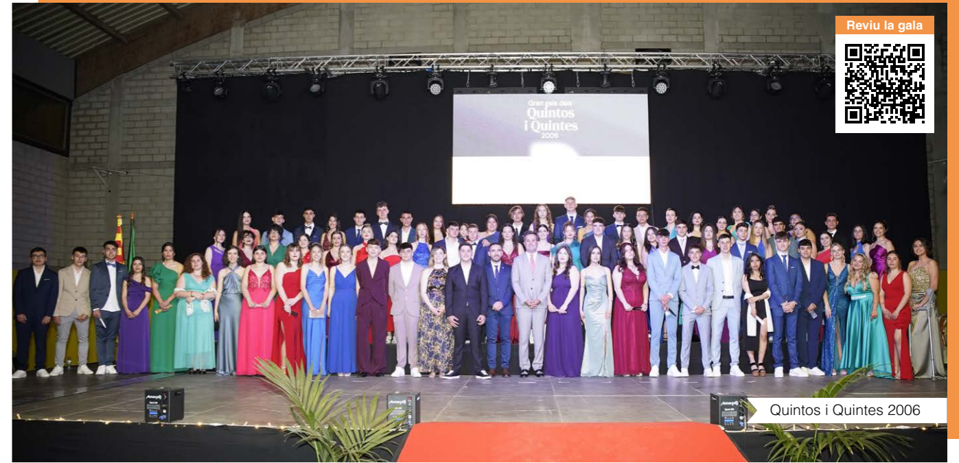
Reviu la gala