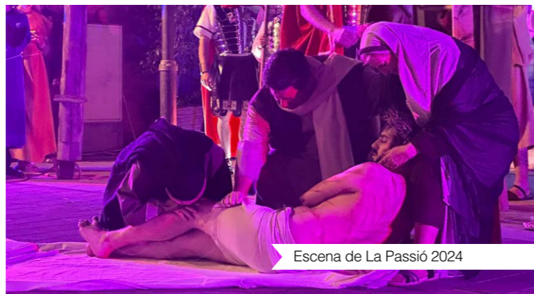
Escena de La Passió 2024

“Per a l'any que ve la idea és augmentar algun passe més, que hi hagi alguna sessió més. I també volem vendre entrades anticipades. També estem treballant en una gran novetat, un altre projecte paral·lel que estem embrionant i que serà des de la perspectiva femenina.”