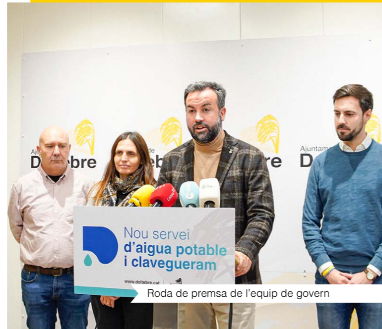
Roda de premsa de l'equip de govern

Gràcies al nou contracte, es realitzarà una inversió d'uns 2.500.000 € per a la renovació i millora de la xarxa d'aigua potable, atès que aquesta representa un dels problemes estructurals més greus del municipi, tal com indiquen les dades. I és que, actualment, a Deltebre s'acaba perdent un 70 % de l'aigua que circula per la infraestructura municipal d'abastament d'aigua potable. Amb el nou contracte s'espera reduir aquestes pèrdues d'aigua, com a mínim, en un 20 %.