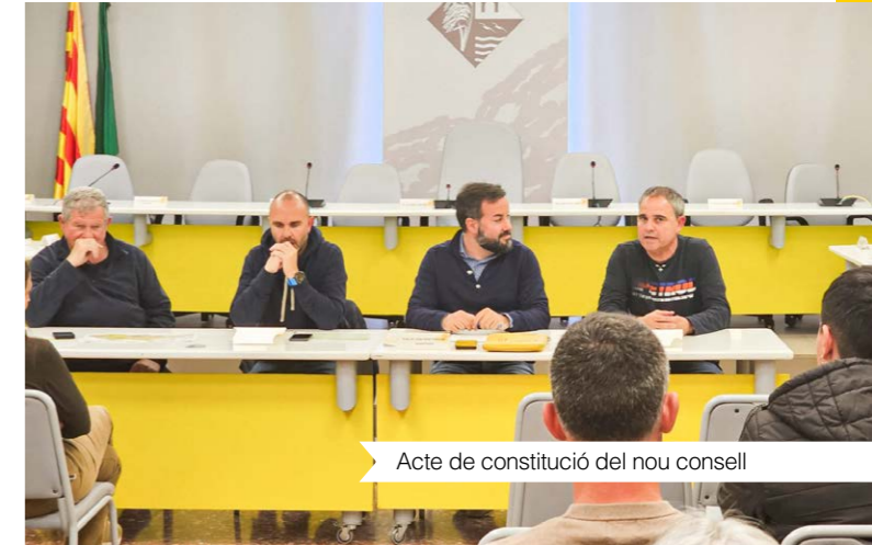
Acte de constitució del nou consell

Entre el desplegament de diferents consells de participació ciutadana impulsats per l'Ajuntament de Deltebre, trobem també la nova constitució del Consell Municipal del Sector Primari. L'objectiu d'aquest òrgan és el de vetllar per les diferents qüestions i interessos d'aquest sector de forma transversal, i tenint en compte la gran contribució que representa en el desenvolupament de l'economia del municipi.