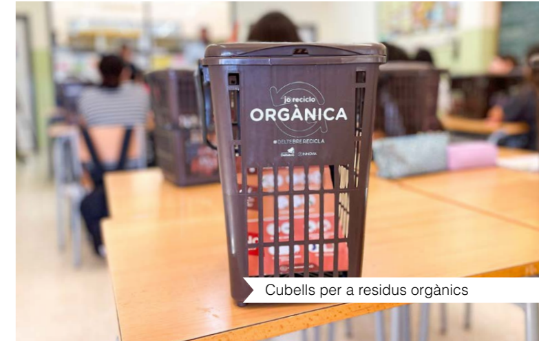
Cubells per a residus orgànics

La matèria orgànica és l'element més abundant de la bossa de la brossa. Separant-la del rebuig, transformem aquests residus en recursos aprofitables, estalviem recursos naturals i energia, i tenim cura del nostre entorn.