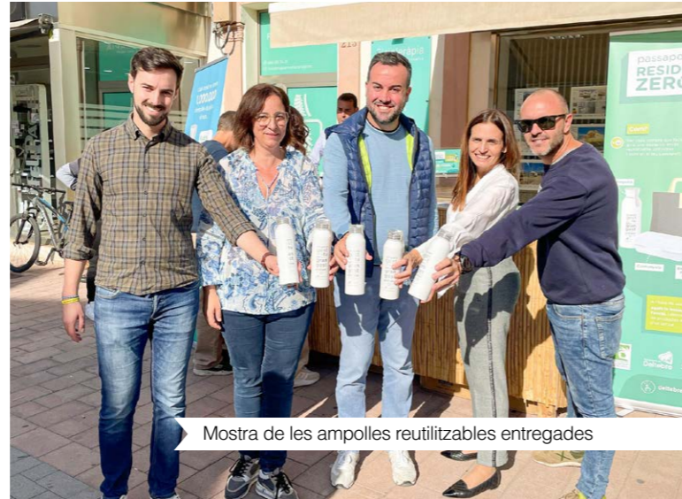
Mostra de les ampolles reutilitzables entregades

Per incentivar-ne la participació, a cada persona que va respondre l'enquesta se li va entregar gratuïtament una ampolla reutilitzable, de tal manera que la campanya també ha servit per disminuir els envasos d'un sol ús. L'acció va estar complementada per d'altres dues: una a les escoles amb la distribució d'una edició didàctica del Joc de l'Oca, i l'altra als mercats municipals amb la creació del Passaport Residu Zero i el sorteig de 25 lots de productes reutilitzables per al dia a dia.