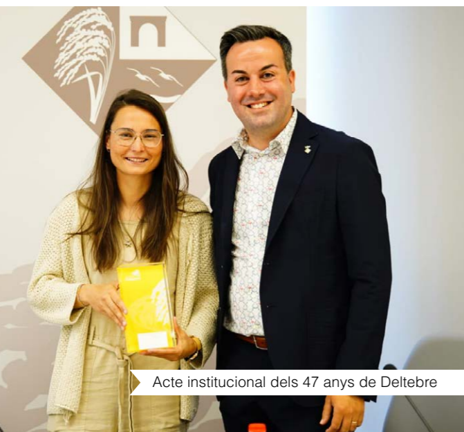
Acte institucional dels 47 anys de Deltebre

"Crec que no soc la persona més indicada per donar algun consell, però a mi m'hagués agradat que en el seu moment em diguessin que aprofités al màxim les oportunitats i les experiències que venen. A més, des d'una perspectiva personal, crec que l'èxit no sempre es mesura amb reconeixements individuals o grupals, sinó també amb petits detalls que poden semblar insignificants, però que fan una gran diferència en la nostra vida."