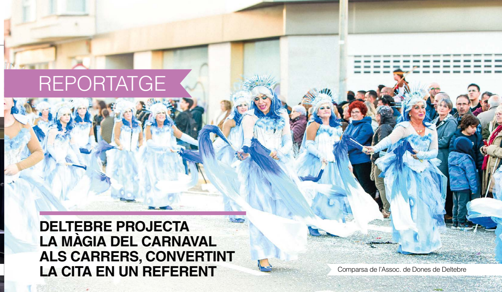
Comparsa de l'Assoc. de Dones de Deltebre

Aquesta és la vuitena edició d'ençà que l'Ajuntament de Deltebre va decidir recuperar i impulsar els actes del Carnaval. Una festa que durant aquests anys s'ha consolidat com a activitat de referència per a la ciutadania del municipi, però també per a la del territori gràcies a la participació massiva en els diferents actes programats durant el cap de setmana.