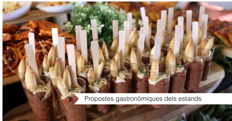
Propostes gastronòmiques dels estands