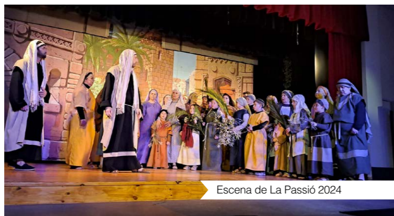
Escena de La Passió 2024