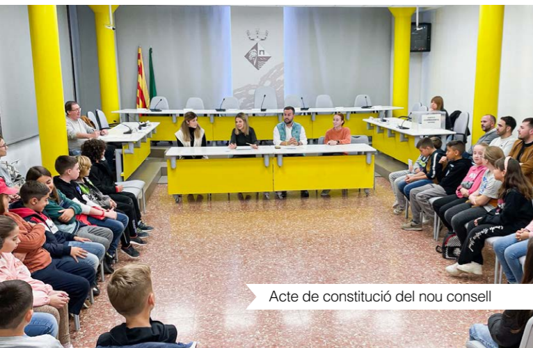
Acte de constitució del nou consell