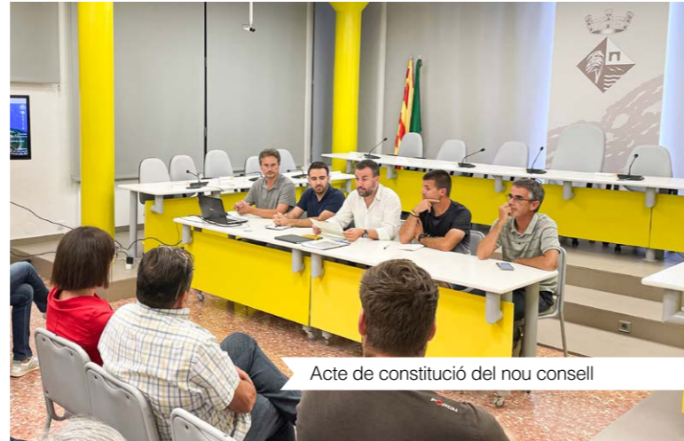
Acte de constitució del nou consell

El passat octubre, davant la proposta de delimitació proposada per l'estat espanyol, es va renovar i constituir el Consell de Defensa #DeltebreTerritori. Un òrgan que compta amb la participació de més de 40 representants de diferents sectors per fer front, des de la suma d'esforços, davant de la inacció històrica, de la manca de coordinació entre les administracions competents i dels atacs constants que debiliten el futur del Delta.