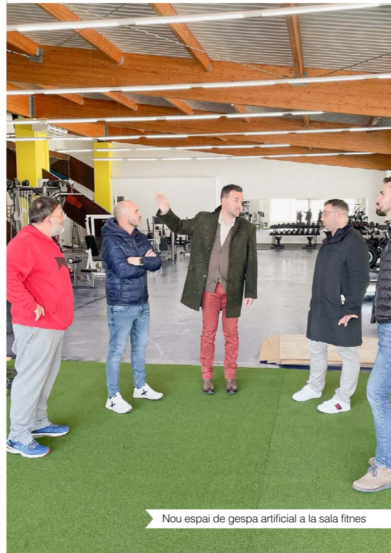
Nou espai de gespa artificial a la sala fitness

Consulta els horaris de les classes dirigides: centreesportiu.deltebre.cat