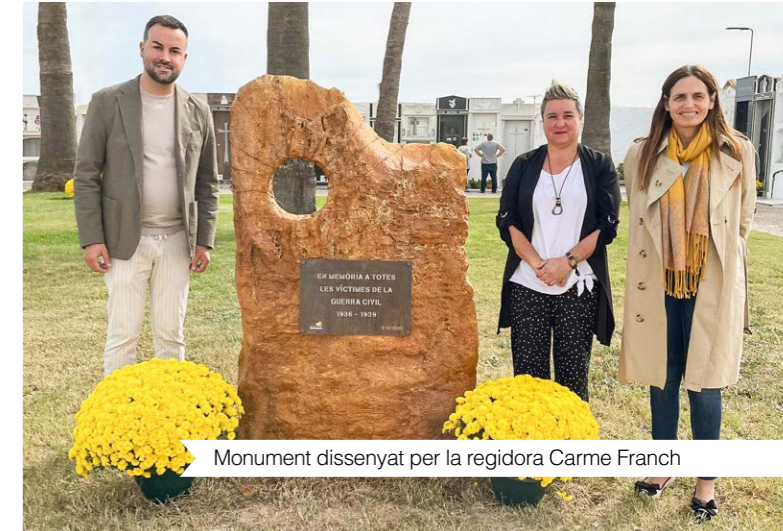
Monument dissenyat per la regidora Carme Franch

Aquesta actuació se suma a l'espai en memòria de les persones traspasades per la COVID-19 (2022) i l'espai de Dol Perinatal (2021). Tots tres espais destinats a les accions de millora efectuades al cementiri per tal de dignificar-lo.