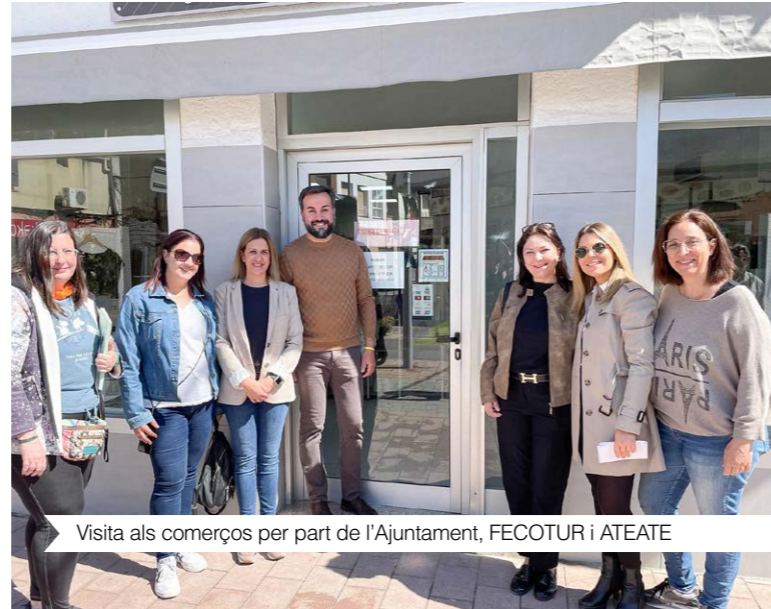
Visita als comerços per part de l'Ajuntament, FECOTUR i ATEATE

En aquest sentit, durant el darrer any, el consistori ha estat instal·lant pictogrames en equipaments municipals i espais d'interès i freqüentats pels infants, així com s'han pintat pictogrames en els passos de vianants. Totes aquestes accions s'han efectuat amb la col·laboració d'ATEATE, entitat que ha facilitat el corresponent ús dels diferents pictogrames amb la suma de Montea Centre.