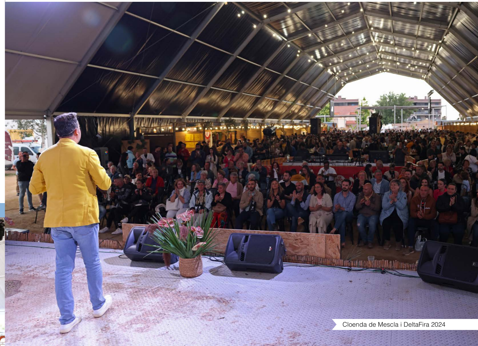
Cloenda de Mescla i DeltaFira 2024

Transformar el Préstamo en el Passeig del Carrilet és un dels projectes més ambiciosos de la història de Deltebre; hem de ser molt curosos"