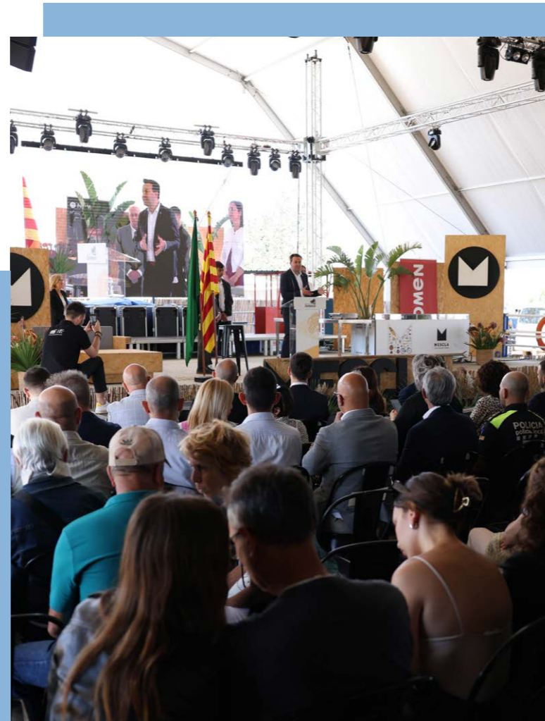
Inauguració de Mescla i DeltaFira 2024

I, d'altra banda, estem en ple procés de la licitació de la segona i tercera etapa de la primera fase, la qual ens ha de permetre seguir amb tot el procés de canalització i bombament del Préstamo, així com amb la nova via cicloturista que conformarà el Passeig del Carrilet."