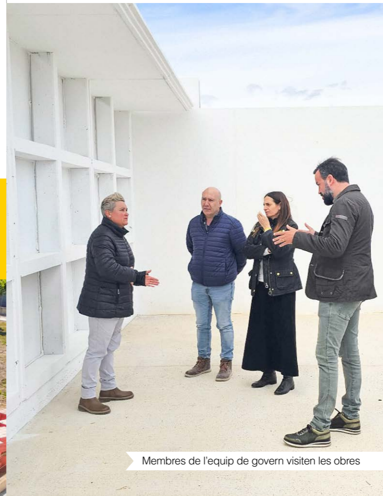
Membres de l'equip de govern visiten les obres

En aquest sentit, durant els darrers quatre anys se n'han construït un total de 102 nínxols, amb una inversió de prop de 60.000 €, sent una acció que permet donar cobertura a la necessitat d'ampliació, millora i adequació del cementiri. Entre totes aquestes actuacions també hi tenen lloc la ubicació de l'espai en memòria a totes les persones que van perdre la seva vida durant la Guerra Civil, l'espai en memòria de les persones traspassades per la COVID-19, i l'espai de Dol Perinatal.