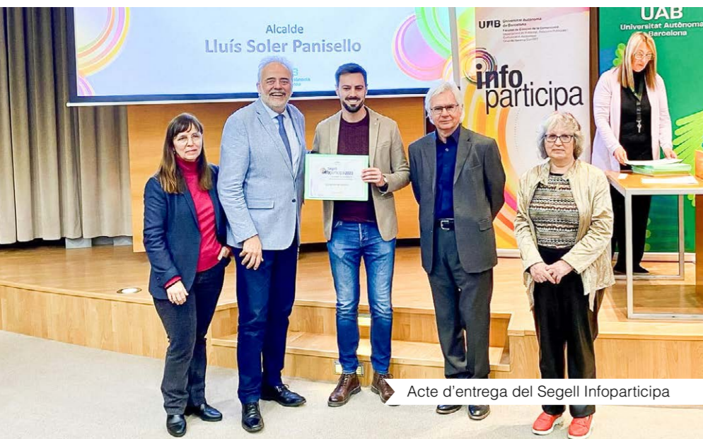
Acte d'entrega del Segell Infoparticipa

Val a dir que Deltebre és un dels 116 ajuntaments, dels 947 de tota Catalunya que ha obtingut el segell en aquesta ocasió. De fet, el compromís del govern municipal amb la gestió transparent i participativa, pel rendiment de comptes amb la ciutadania, l'ha fet passar d'un suspès el 2014 (puntuació de 34,15 %) a un excel·lent el 2024 (96 %).