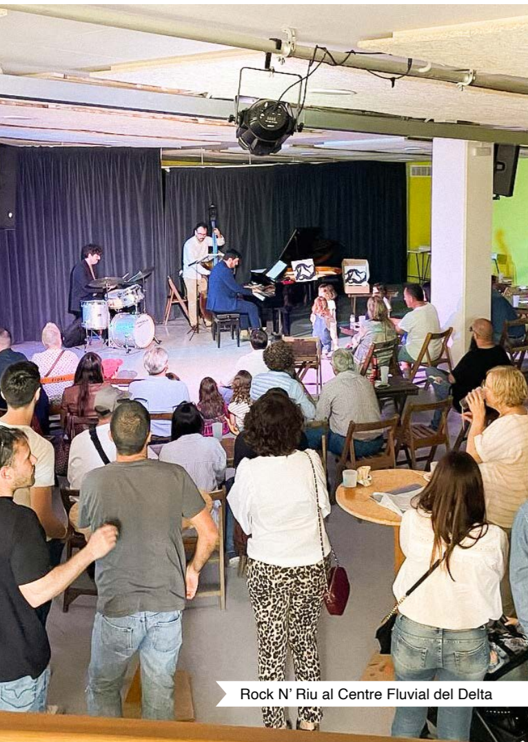
Rock N' Riu al Centre Fluvial del Delta

+ Els orígens del festival es remunten al 1996, amb Rock&Mar