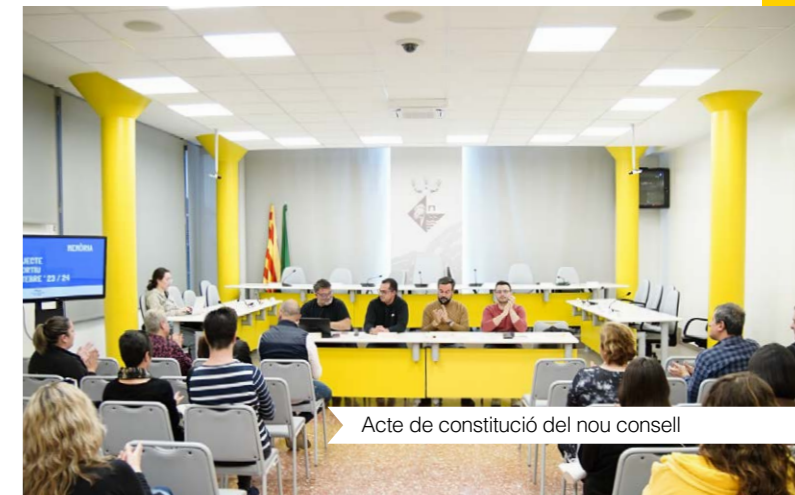
Acte de constitució del nou consell

Continuant amb els consells de participació impulsats per l'Ajuntament de Deltebre, s'hi afegeix la constitució del Consell Municipal d'Esports, que renova amb la finalitat d'enfortir el seu objectiu de fomentar i promocionar la pràctica esportiva al municipi. D'aquest òrgan en formen part les diferents entitats esportives del municipi amb la finalitat de crear sinergies i participar en totes aquelles qüestions que ajuden a definir el model esportiu de Deltebre.